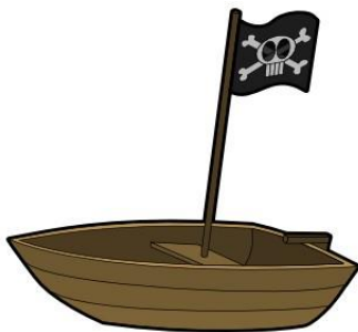
"Dieses Foto" von Unbekannter Autor ist lizenziert gemäß CC BY-NC

Diese Insel ist auch schön. Aber hier wohnt auch niemand.